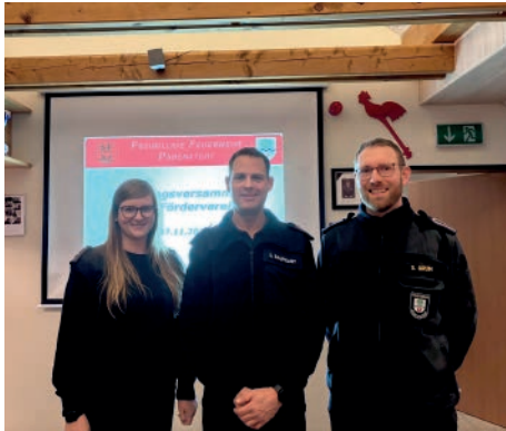
Abbildung 7: Der Vorstand des frisch gegründeten Fördervereins

Feuerwehr Padenstedt punktuell weiter verbessern und freut sich über fördernde Mitglieder. Neben dem Gemeindehaushalt und der Kameradschaftskasse wird hoffentlich eine dritte Finanzierungssäule entstehen, die für noch bessere Bedingungen für Bürger und Einsatzkräfte sorgt, denn die eine oder andere Veränderung in unserem Einsatzgebiet wartet ab 2027 auf uns. Vielen Dank an alle, die schon dabei sind. Wir werden an dieser Stelle sicherlich zukünftig über die umgesetzten Maßnahmen berichten.