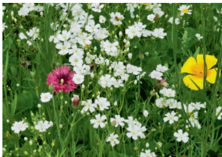
Bild 2 - Die Blühwiese im Juli