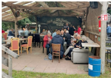
Bild 3 - Spanferkelessen im Juni

Wegen des trockenen Frühjahrs befürchteten wir schon, dass „unser“ Storchenpaar keinen Nachwuchs durchbringen würde. Nachdem drei Jungvögel schlüpften, gelang es den Eltern immerhin zwei davon großzuziehen. Der dritte Jungvogel überlebte leider nicht. Nach den ersten zwei Jahren ohne Bruterfolg -wahrscheinlich waren die Störche noch nicht geschlechtsreif- konnte das Storchenpaar in 2024 und in diesem Jahr erfolgreich Nachwuchs aufziehen. Wir hoffen, dass diese Serie sich auch im kommenden Jahr fortsetzen wird und werden gespannt ab der zweiten Märzwoche Ausschau nach „unseren Störchen“ halten. (Bild 4)