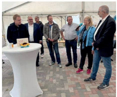
Begrüßung der Gäste und des Ministerpräsidenten