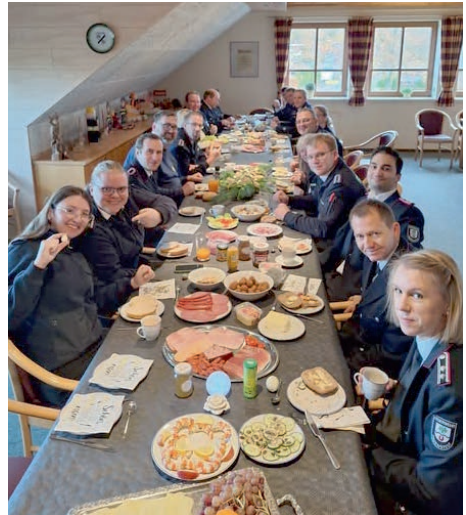
Abbildung 8: Frühstück am Volkstrauertag

Neben unseren zahlreichen und abwechslungsreichen Diensten kommt natürlich die in der Feuerwehr viel beschworene Kameradschaft während und nach den Diensten nicht zu kurz. Im Anschluss an die Toten ehrung am Volkstrauertag stand z.B. ein gemeinsames und sehr leckeres Frühstück an, bei dem ausgiebige Gespräche geführt wurden. Gleiches gilt für alle unsere Dienste am Montag und Freitag, die häufig in geselliger Runde ausklingen. Zum Abschluss des Jahres steht noch die traditionelle Weihnachtsfeier im Kalender, bevor wir voller Tatendrang ins Jahr 2026 starten.