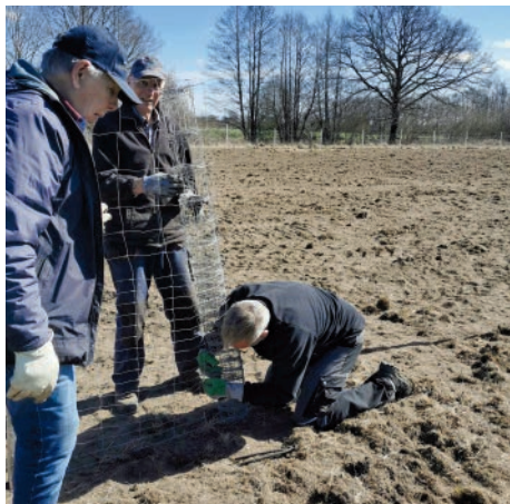
Bild 1 - Vereinsmitglieder beim Anlegen der Blühwiese

Das diesjährige Spanferkelessen war mit ca. 45 Personen gut besucht und fand zum