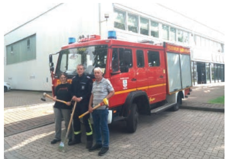
Abbildung 6: Werkzeugübergabe durch Firma Ackrutat

Im Hintergrund wurde das Projekt MZF weiter vorangetrieben und ist nach einem Jahr sehr weit gekommen. Durch Privatspenden von Bürgern (Sobotta und Zander) und Firmenspenden (Buchholz, Ackrutat sowie Böge&Söhne) konnte die Ausstattung des Fahrzeugs weiter verbessert werden, um für Einsätze im Bereich Technische Hilfeleistung professionell aufgestellt zu sein. Hier werden weitere Schritte folgen, die unsere Ausbildungsqualität beginnend bei den Jüngsten weiter steigern werden. Vielen Dank für die Unterstützung bei diesem außergewöhnlichen Projekt!