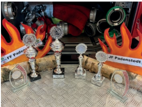
Abbildung 1: Unsere Ausbeute beim Feuerwehrtag in Aukrug

Unser letzter Bericht in der Dorfzeitung endete mit den Vorbereitungen für den Amtfeuerwehrtag, bei dem wir in diesem Jahr mit einem reinen Frauenteam bei der Einsatzübung nach dem Pokal gegriffen haben. Mit Platz 2 in der Gesamtwertung hat es denkbar knapp nicht ganz geklappt, aber wir konnten unsere Gemeinde wieder bestens präsentieren und haben während der fünfwöchigen Vorbereitung und am Festtag