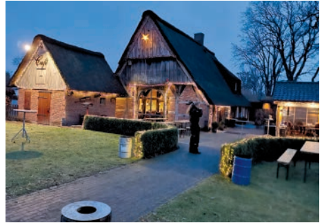
Bild 5 - Der geschmückte Platz vor dem Tannbaumerleuchten

Bezüglich der inzwischen schon traditionellen Veranstaltung „Tannenbaumerleuchten mit Weihnachtsjazz“ kann ich mich nur jedes Jahr wiederholen: Auch dieses Jahr bei gu-