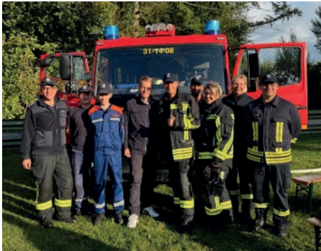
Abbildung 5: Unser Ministerpräsident zu Besuch im Dorf

Gleiches gilt für unsere neue und schlagkräftige AED-Gruppe. Hier haben wir viel Zeit in unsere Ausbildung investiert und sehen uns gut vorbereitet auf mögliche Notfalleinsätze. Vielen Dank an dieser Stelle, an die Kameraden aus Arpsdorf, Wasbek und Neumünster, die uns hier tatkräftig unterstützt haben. Das kurze Treffen mit Ministerpräsident Daniel Günther war für eine Abordnung unserer Wehr, die beim Familienfest der örtlichen CDU eingebunden war, sicherlich auch ein Highlight des Jahres.