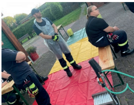
Abbildung 4: Ein weiterer Schwerpunkt ist aktuell das Thema Hygiene

Ein weiteres Schwerpunktthema im letzten Halbjahr war die Einsatzstellenhygiene.