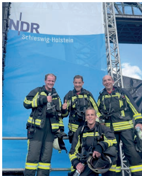
Abbildung 3: Platz 2 beim Ruder-Cup in Rendsburg

die im Sommer durch die sozialen Medien schwappte. Die beiden Obstbäume bereichern die Obstwiese „Am Steen“.