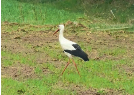
Bild 4 - Ein Storch auf einer Padenstedter Wiese

Die Zahl der Brutpaare wächst in Schleswig-Holstein kontinuierlich. In diesem Jahr gab es so viele Weißstorch-Brutpaare wie seit 1969 (ca. 580) nicht mehr. Auch die Zahl der Jungstörche wächst auf ca. 1000. Besonders stark ist die Zunahme an der Westküste. Ein Grund für diese Zunahme der Brutpaare liegt nach Angaben von Experten auch daran, dass die Störche nicht mehr nach Osten ziehen, sondern eher die kürzere Westroute bevorzugen und dann zum Teil auch schon in Spanien überwintern.