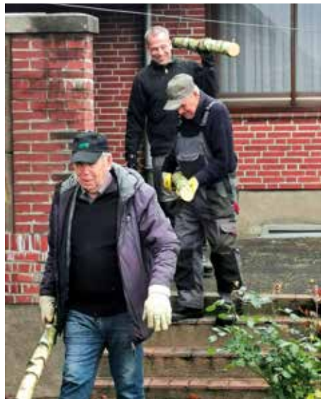
Transport der Birkenstämme zur Werkstatt