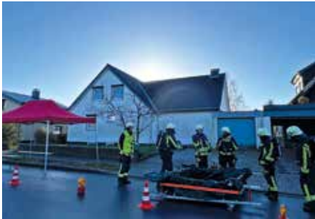
TM2-Trainingstag mit Gefahrgut-Einsatzübung

Oktober wieder die Belastungsprüfung bei der Berufsfeuerwehr Neumünster und übten zudem im Brandübungscontainer in Rendsburg. Natürlich waren wir auch wieder beim Laternenlauf der WGP zahlreich vertreten und haben uns beim Novemberdienst dem Thema Erste-Hilfe gewidmet. Bei Trainingsdiensten im Herbst waren wir z.B. als Panzerknacker am Kindergarten aktiv und haben uns mit Tierrettung beschäftigt. Abgerundet wurde das Ausbildungsprogramm mit einem Trainingstag Gefahrgut im Rahmen der TM2-Grundausbildung.