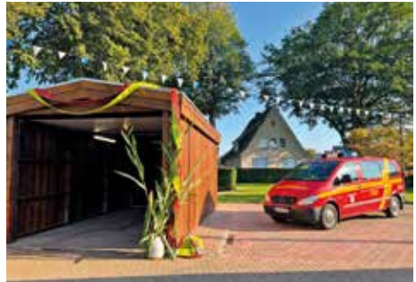
Der MTW neben seiner neuen Garage.