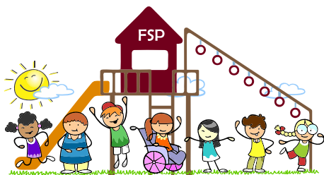
Förderverein Spielplatz Padenstedt e.V.

Das Jahr geht zu Ende. Doch bevor wir unsere Aufmerksamkeit voller Vorfreude ins neue Jahr stecken und uns viele Dinge vornehmen, sollten wir nochmals zurückblicken. Dieses Jahr war herausfordernd, aber auch voller Möglichkeiten. Wir sind stolz darauf, mitteilen zu können, dass wir viele Ziele erreichen konnten.