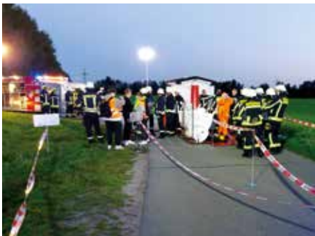
Einsatzübung mit der FF Arpsdorf und dem LZG Neumünster

Wir blicken auf ein ruhiges Halbjahr ohne herausragende Highlights zurück und dennoch liegt eine abwechslungsreiche und aktive Zeit hinter uns. Im Juli/August gab es ein Ferien-Trainingsprogramm für Atemschutzgeräteträger, bei dem wir die Gebäude-Innenbrandbekämpfung unter Atemschutz trainiert haben. Im Rahmen der Dienste von August bis Oktober standen Einsatzübungen mit den Themen Wald-/Flächenbrand, Verkehrsunfall mit Gefahrstoffaustritt und klassischer Brandeinsatz Gebäude auf dem Plan. Daneben haben wir an zwei Funkübungen in Arpsdorf und Ehndorf teilgenommen.