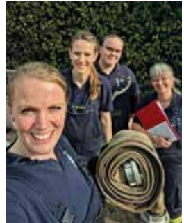
Frauenpower bei der Hydrantenpflege

Parallel zur Aus- und Fortbildung hat sich die Arbeitsgruppe Bedarfsplan wieder zusammengefunden, um den Brandschutz-Bedarfsplan für unsere Gemeinde zu überarbeiten, sodass die Version