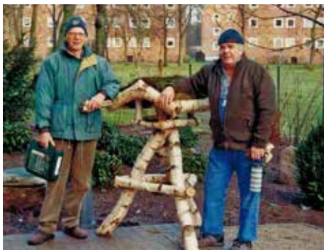
Das fertige Produkt

Sie konnten entweder begrünt oder mit Reet gedeckt erworben werden. Inzwischen dient nur noch Dachpappe als Material, da Reet sehr teuer und nur schwer zu bekommen ist.