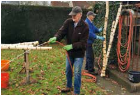
Beim Säubern der Birkenstämme

Da die Birkenstämme zum Teil mit Flechten, Algen und Mikroorganismen bewachsen sind, müssen sie mit Wasser und Bürste ordentlich abgeschrubbt werden (Foto 2). Erst dann geht es in die Werkstatt, wo die Stämme exakt zugeschnitten werden, so dass ein Dreibein entsteht. Dies dient als Grundlage für das eigentliche Häuschen, dessen Grundgerüst mit hochwertigen Siebdruckplatten zusammengeschraubt ist und anschließend mit Birkenholz umrandet wird. Die Dächer wurden in den ersten Jahren in zwei Ausfertigungen hergestellt.