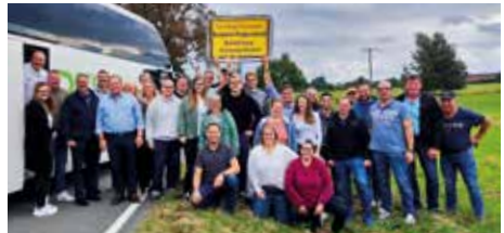
Wir fallen in Nebelin ein.

Es folgte Mitte September ein Trainingstag zu den Themen Dekontamination im Gefahrstoffeinsatz und Trennen von Werkstoffen. Am 23. September waren wir zu unserer Patenwehr nach Nebelin zum Straßenfest eingeladen und verbrachten einen traumhaften Spätsommertag in Brandenburg.